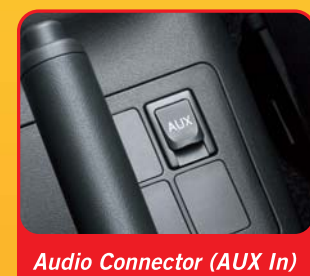
Audio Connector (AUX In)