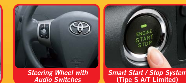
Steering Wheel with Audio Switches