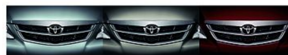
Silver Metallic Champagne Metallic Wine Red

Toyota didukung oleh sales outlet dan layanan purna jual (service & spare parts) yang tersebar di seluruh Indonesia dan selalu siap melayani Anda. Untuk mengetahui dealer Toyota terdekat di kota Anda, hubungi Toyota Customer Care atau Akses Website dan M-Toyota