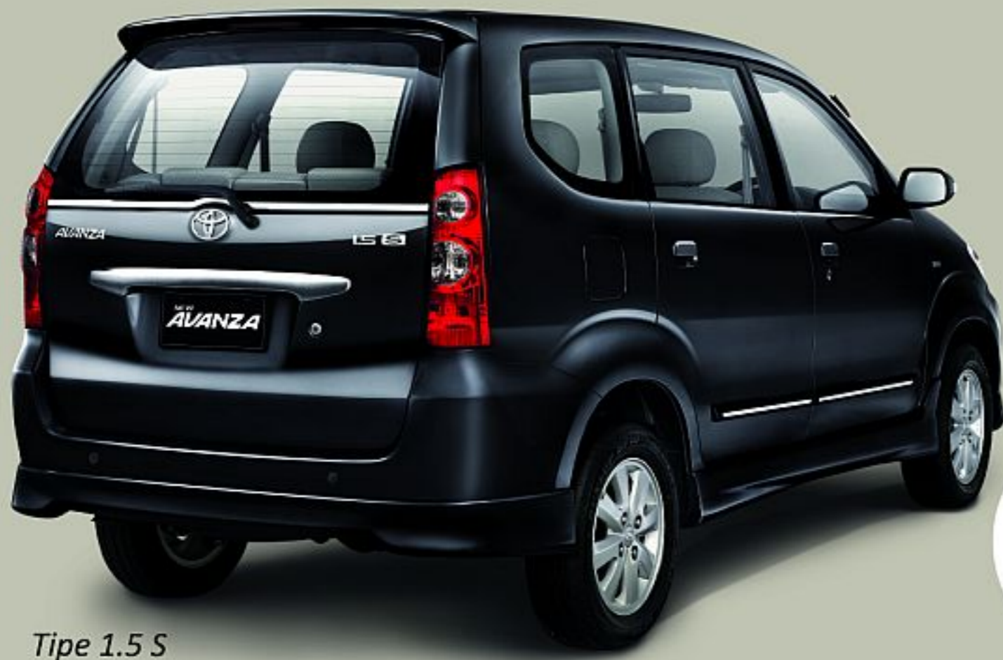
Tipe 1.5 S